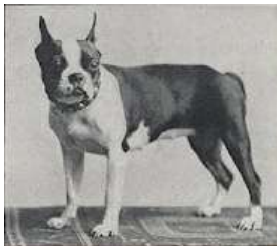
Boston Bull Terrier – 1907 r.