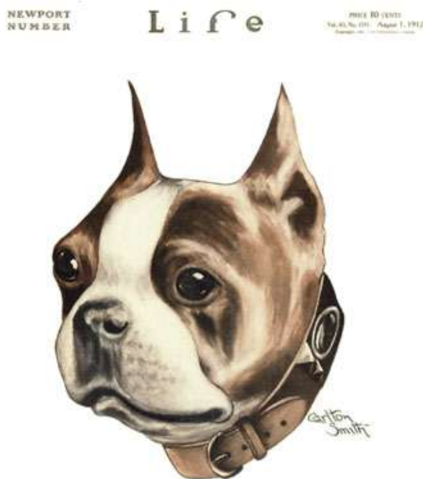
LIFE magazine – Newport Number. “Portrait of a Gentleman” by Carlton Smith 1 sierpnia 1912

Od tego momentu, a szczególnie po roku 1989 bostony zaczęły zyskiwać wielką popularność. Już na początku XX były tak znane, że wykorzystywano je m.in. w reklamach produktów spożywczych. Zyskały wówczas także przydomek "American Gentleman" . W latach dwudziestych bostony stały się jedną z najliczniejszych ras w Stanach Zjednoczonych i ta popularność utrzymuje się do dziś. Wtedy też hodowcy zaczęli zwracać większą uwagę na umaszczenie psów, ich budowę i proporcje poszczególnych organów. W przeszłość odeszła koncepcja wykorzystywania tych psów do walk. Ten proceder stał się nielegalny, ale przede wszystkim bostony zaczęły być postrzegane jako wspaniałe psy, towarzysze człowieka. Znany obecnie wygląd tej rasy został osiągnięty około roku 1950. W roku 1979 w uznaniu zasług bostonów gubernator Massachusetts, Edward King (miłośnik bostonów) nadał im oficjalny tytuł psów stanowych.