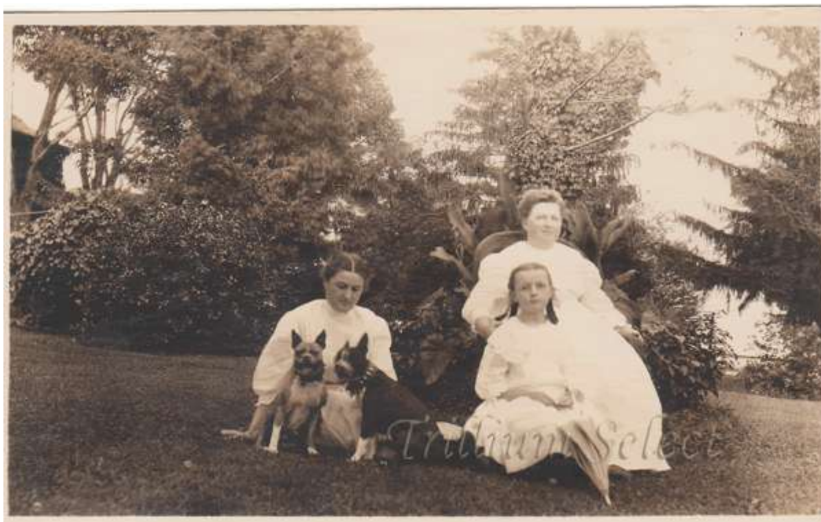
Boston Terriery 1910-1920 r.