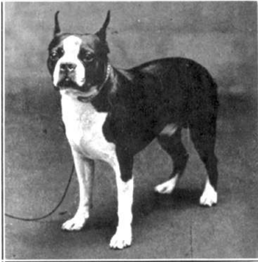
Champion Sonnie Punch