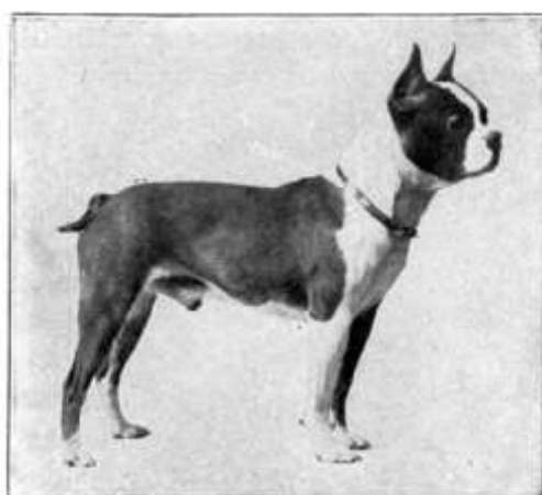
Champion Halloo Prince